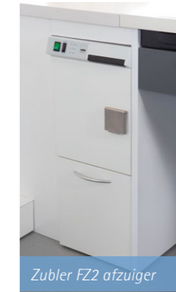
Zubler FZ2 afzuiger