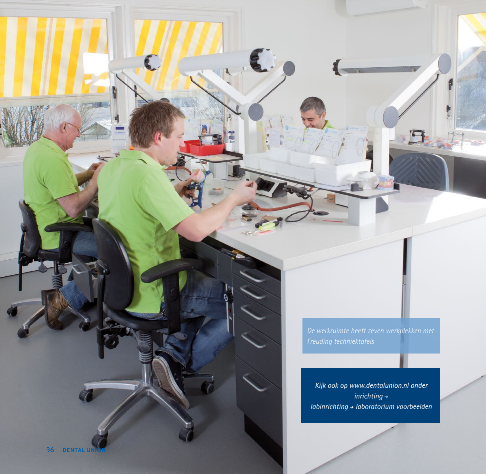
De werkruimte heeft zeven werkplekken met Freuding techniektafels

ner aan de slag te kunnen, worden de tandartsen twee dagen opgeleid in hun praktijk waar ze hun eigen patiënten onder begeleiding kunnen behandelen. Zo hopen we meerwaarde te creëren voor de tandartsen en nog eens te benadrukken dat we een vooruitstrevend lab zijn. En we hopen uiteraard ook zo extra tandartsen aan ons te binden en werk binnen te halen. We hebben nu afspraken gemaakt met vier tandartsen die elk de scanner op een vaste dag in hun praktijk kunnen gebruiken. We sluiten niet uit dat er uiteindelijk meer mondscanners gekocht zullen worden."