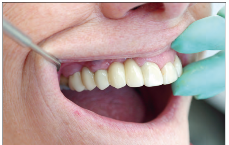
Foto 5: Opgebakken zirkonium brug met 3D geprinte modellen. Foto 6: Eindresultaat.